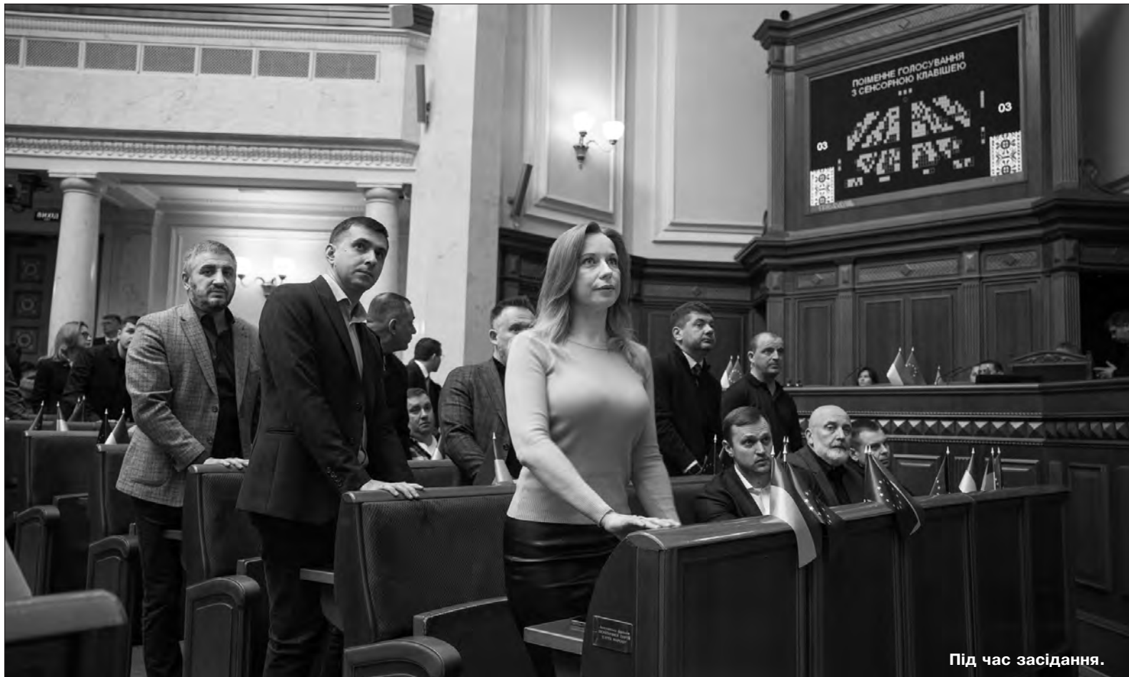
Під час засідання.